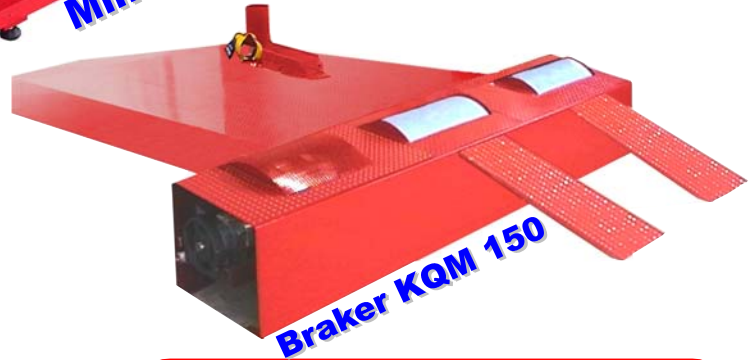
Braker KQM 150